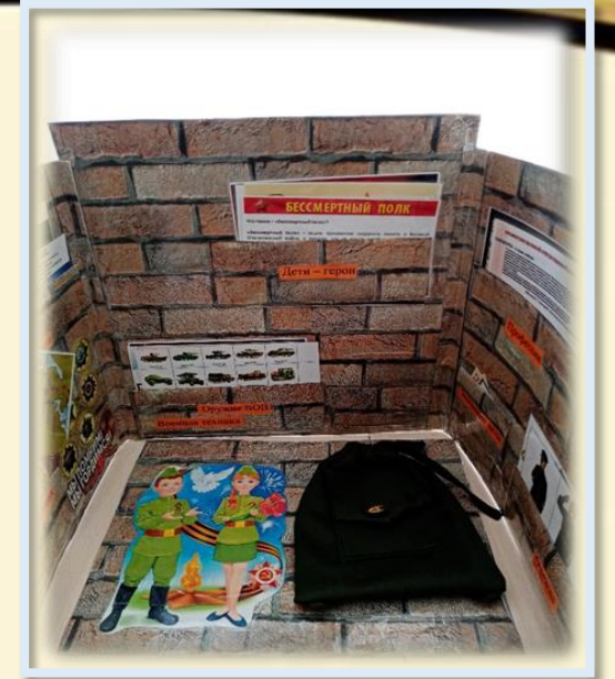
Лэпбуки для детей дошкольного возраста на тему "Великая Отечественная война"